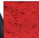
röd | svart