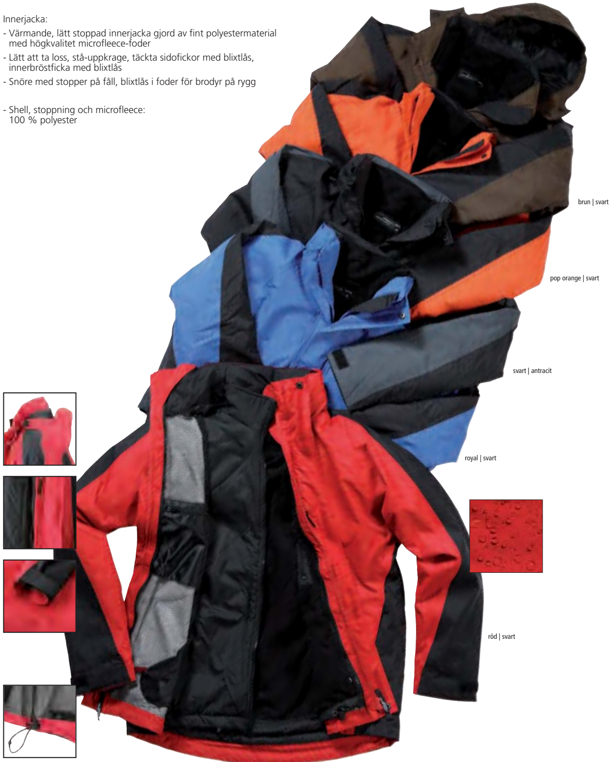
brun | svart